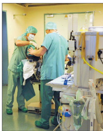
HÔPITAL La caisse unique ne fait pas l'unanimité chez les praticiens.