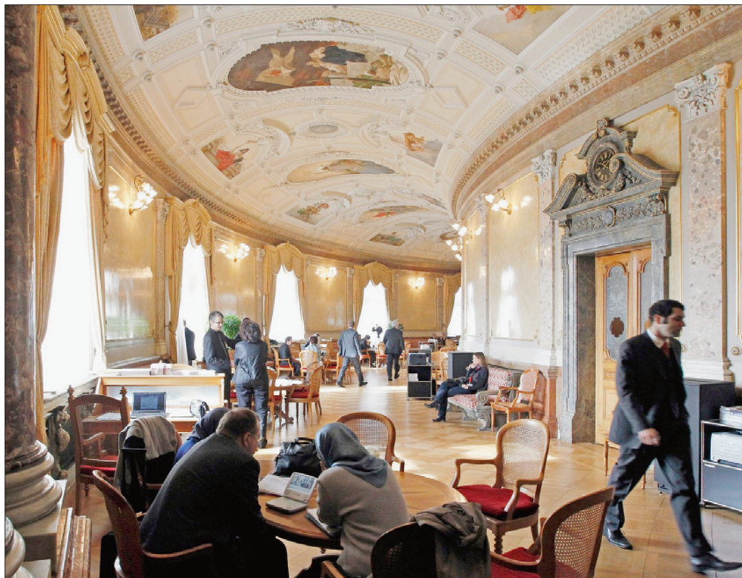
PALAIS FÉDÉRAL La communication est devenue un élément essentiel de l'activité de l'Etat.

Indépendamment des termes utilisés, cette lettre est un instrument de pression qui met en évidence le glissement de l'information à la propagande. Il en va de même des lettres de lecteurs types que l'Office fédéral des réfugiés avait rédigées à l'intention des partis lors de la votation sur l'asile de 1999. Le procédé a depuis lors été reconnu comme abusif, mais il est révélateur d'une tentation permanente. Pour Judith Barben, le